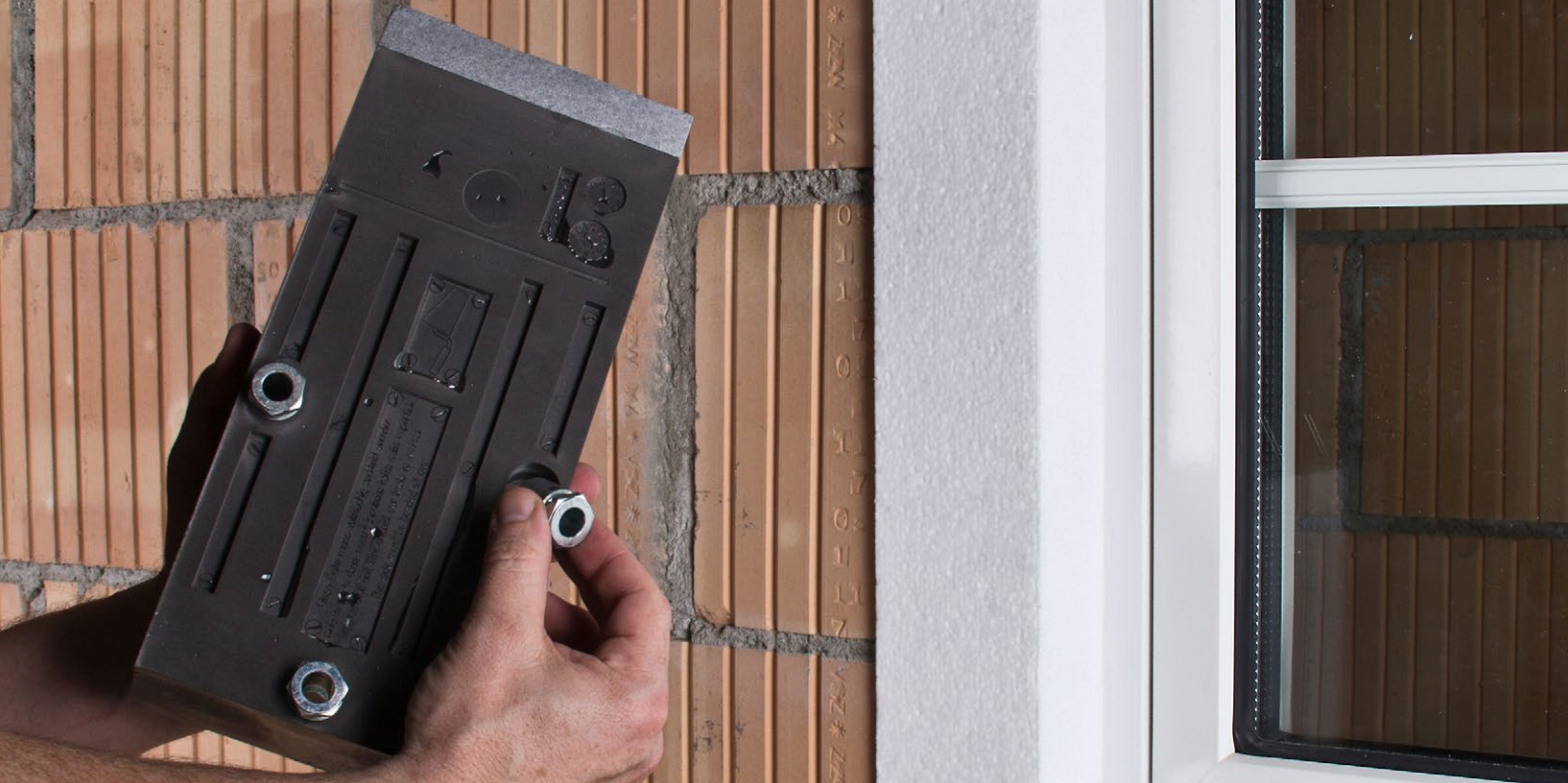
Piedino di regolazione per staffe di montaggio TRA-WIK®-ALU e TWL®-ALU